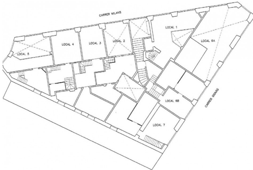
ALTILLO PLANTA BAJA